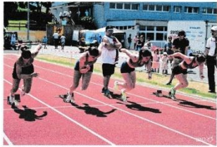
La Fédération veut unir les multiples clubs et associations qui font le sport jurassien.